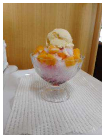
いちごパフェ (ダテパに掲載)