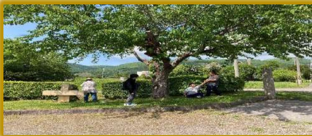
「さくらの木の下で癒しの時間」

新型コロナウイルス感染症により事業所の休止など余儀なくされ全国各地でまだまだ感染、拡大が止まらない状況です。「えーる」は 1 階と 2 階に利用者が分かれて活動しております。感染症対策は徹底して行っていますが、心の健康の為、歌う事、貼り絵、塗り絵、等芸術活動を積極的に取り入れています。こういった活動は心の栄養になると思うので、それぞれの感性や「こうしたい」という声を尊重して行っています。今日は、職員のほっこりしたエピソードを 1 つ紹介したいと思います。