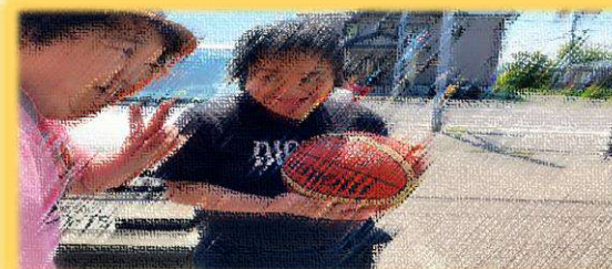
「ボールと仲良く 皆仲良く」