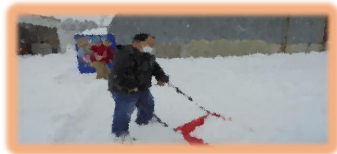
「除雪は誰がやるの？俺でしょ！」