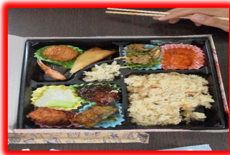
「龍青さんの真心の込められたお弁当」