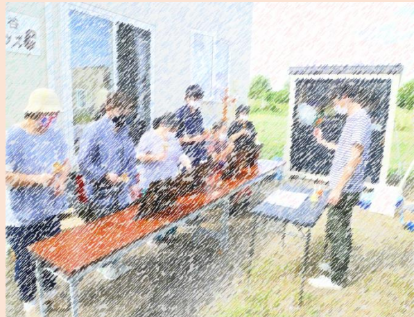
ハンドベルの演奏