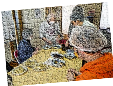
ひなまつり調理レクリエーション